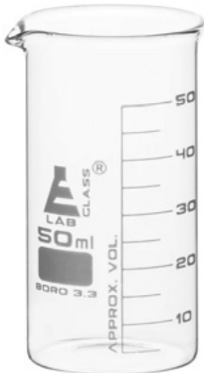
Vasos de vidrio.