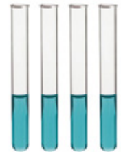
Tubos de ensayo.